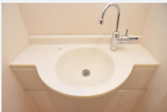
手洗い水栓の動きが硬く、使いづらさを感じる状態でした。