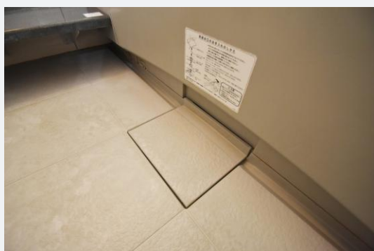
床の水あかが落ちにくく、排水口まわりの清掃に時間がかかっていました。