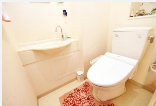
美観は保たれていましたが、設備は旧型のままでした。