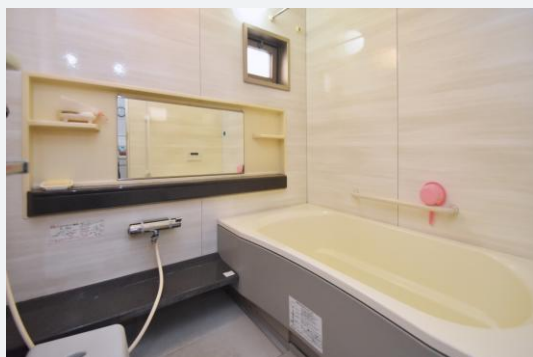
鏡まわりの黒ずみや床の汚れが残りやすく、掃除に手間のかかる状態でした。